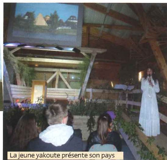
La jeune yakoute présente son pays