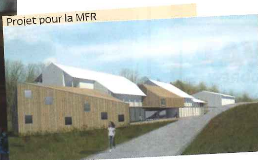
Projet pour la MFR