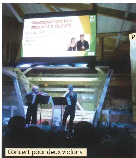
Concert pour deux violons

Cette réalisation a reçu l'adhésion de tous les responsables politiques et professionnels locaux, départementaux et régionaux, et elle correspond à l'évolution de la filière bois qui est en lien avec celle de la plasturgie. Elle sera très certainement un outil favorable au développement économique de notre région.