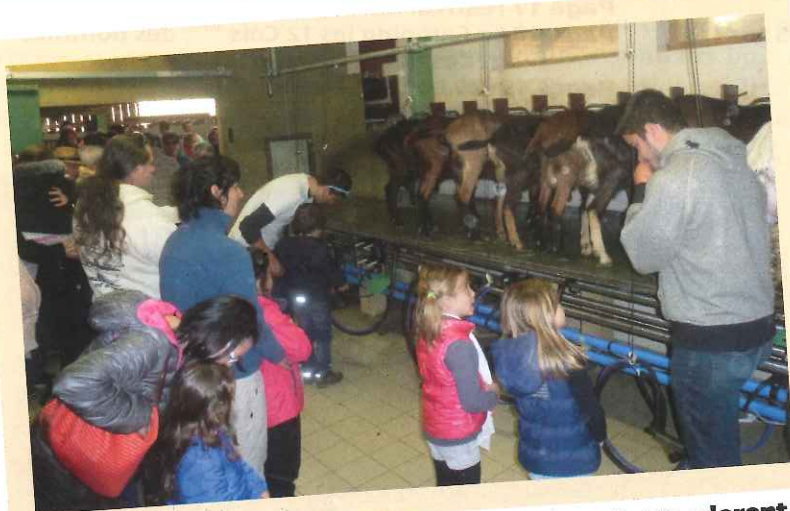
Deux journées pour découvrir les fermes : les enfants adorent !